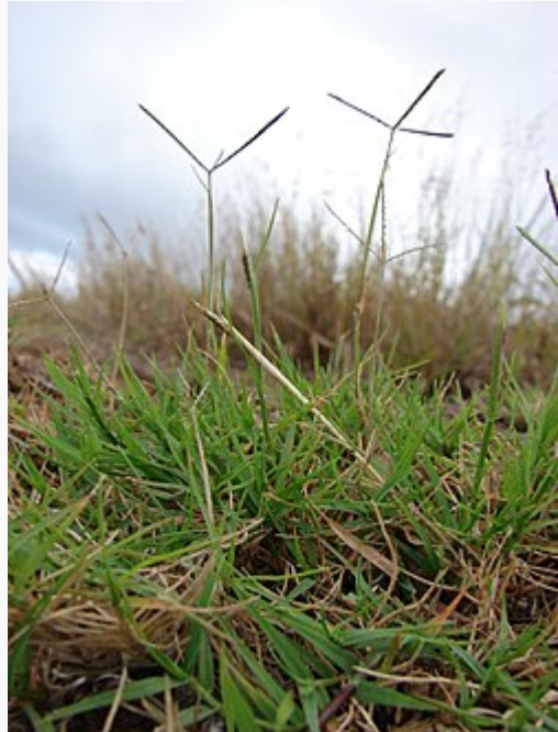
Un ejemplo del género: Cynodon dactylon