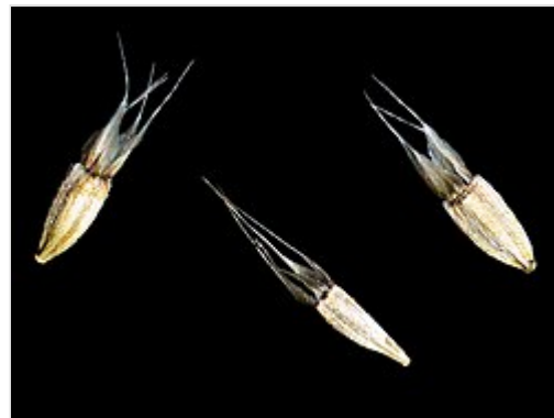
Catananche caerulea (hierba cupido): Cipselas sueltas.