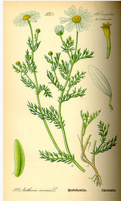
( Anthemis arvensis )